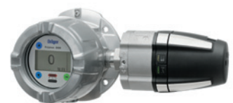
Dräger Polytron 8720 Взрывозащищенная измерительная головка для контроля концентрации диоксида углерода.